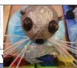
O comme OTARIE