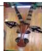
A comme ANTILOPE