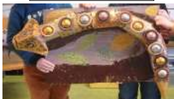
B comme BOA