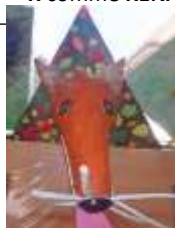
R comme RENARD