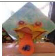
X comme XÉNOPE