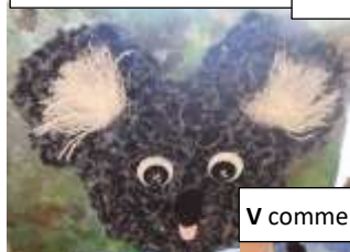
K comme KOALA